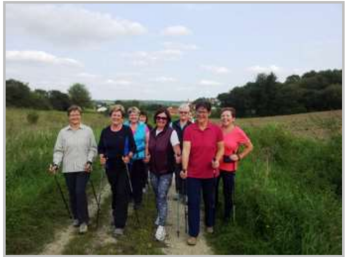
Nordic-Walking Stöcke können zur Probe bei Bedarf ausgeliehen werden.